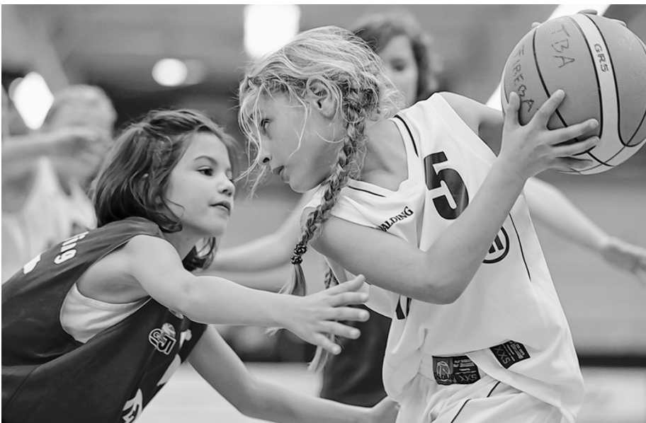
Spannendes Verfolgerduell in der Bezirksliga U11 zwischen Bad Aibling und ASV Rott (30:36)