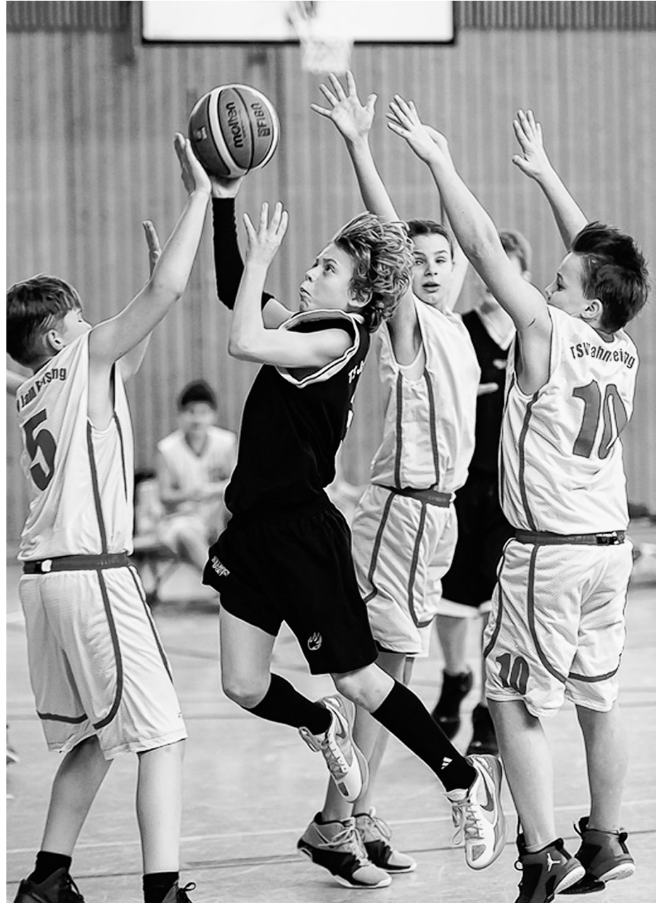
Spitzenspiel in der Bezirksoberliga U12: Freising gegen Jahn München (66:63)