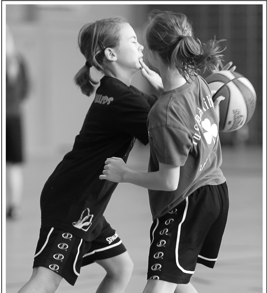
Hoppala... (gesehen bei der ersten Sichtung für die Bezirksauswahl 2011)