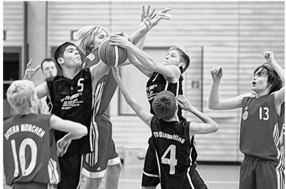
Reboundgerangel aus dem Bezirkligaspiel der U14M zwischen TV Dingolfing und Bayern München. Der ungeschlagene Tabellenführer aus München siegte 97:54.