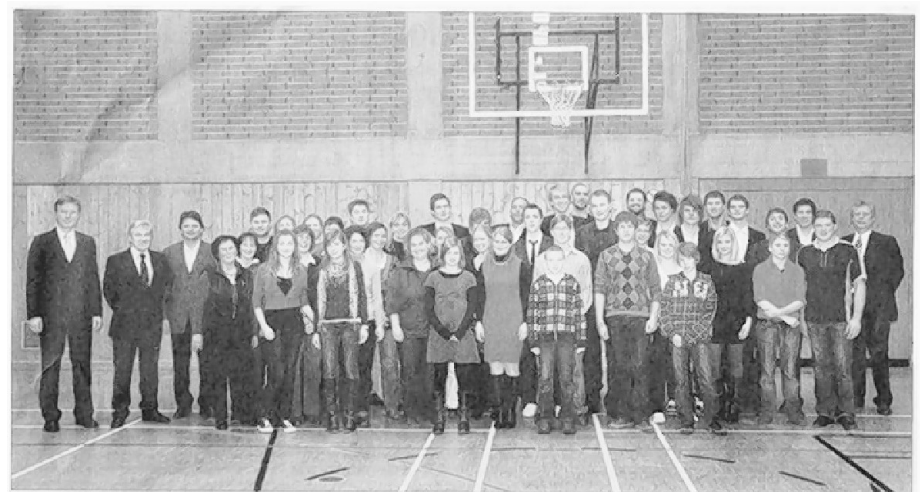
Eine schrecklich nette Sportfamilie: Bei der Jahresabschlussfeier des TSV Vilsbiburg wurden die erfolgreichsten Athleten des Vereins ausgezeichnet.

Mit zwei Ehrungen als „Mannschaft des Jahres“ und für einen „Nachwuchssportler des Jahres“ waren die Vilsbiburger Basketballer die großen Abräumer bei der Gala ihres Vereins (s. Zeitungsaufriss re.).